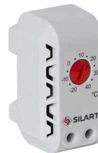
TBS-140 NC, -20 ... +40

Рекомендуемые термостаты для управления данным устройством