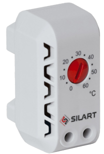
TBS-160 NC, 0 ... +60